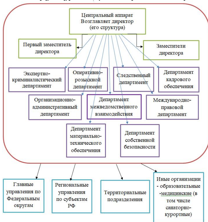
Рис. 1. Структура специализированного органа

Предлагаем выделить специализированный орган с сохранением штатной численности, представить его структуру следующим образом: состоит из Центрального аппарата и входящих в его структуру 9 департаментов (экспертно-криминалистический департамент, оперативно-розыскной департамент, следственный департамент, департамент кадрового обеспечения, организационно-административный департамент, департамент межведомственного взаимодействия, международно-правовой департамент, департамент материально-технического обеспечения, департамент собственной безопасности), возглавляет Центральный аппарат директор, который имеет первого заместителя и заместителей директора. Центральному аппарату подчинены Главные управления по Федеральным округам, региональные управления по субъектам РФ, территориальные подразделения и иные организации (образовательные, медицинские), и заниматься совершенствованием организацией работы изнутри (см.: Рис. 1).